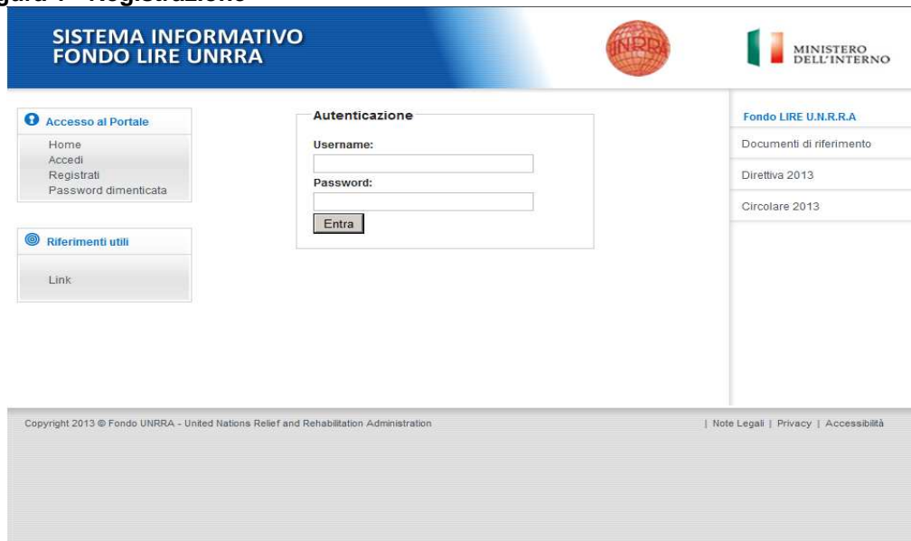
Figura 1 - Registrazione