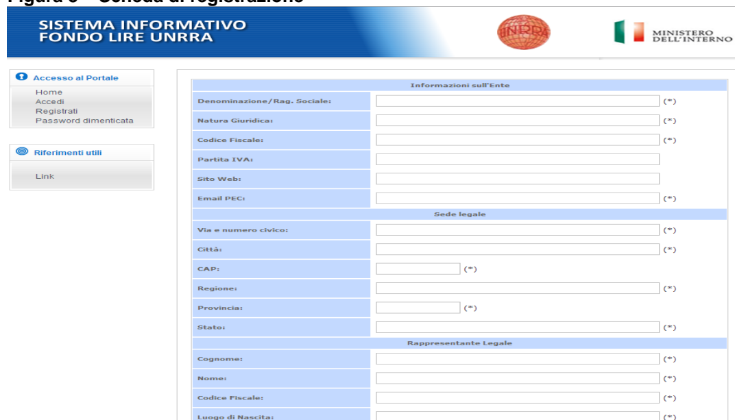
Figura 3 – Scheda di registrazione