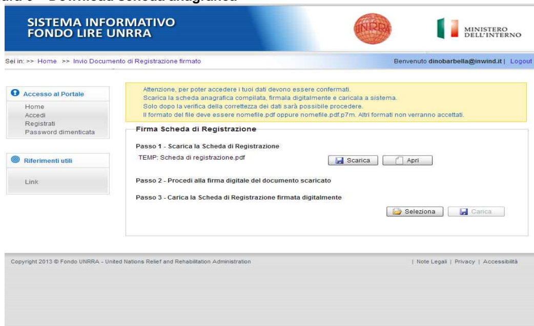
Figura 6 – Download scheda anagrafica