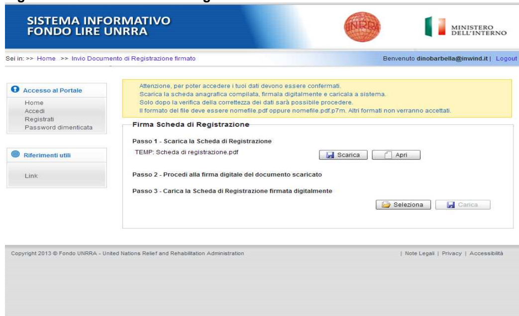
Figura 7 – Carica la scheda anagrafica

Dopo aver caricato la scheda di registrazione al sito, è possibile accedere al sito stesso con le credenziali fornite nella scheda di registrazione per caricare e gestire le proprie proposte progettuali (figura 8).