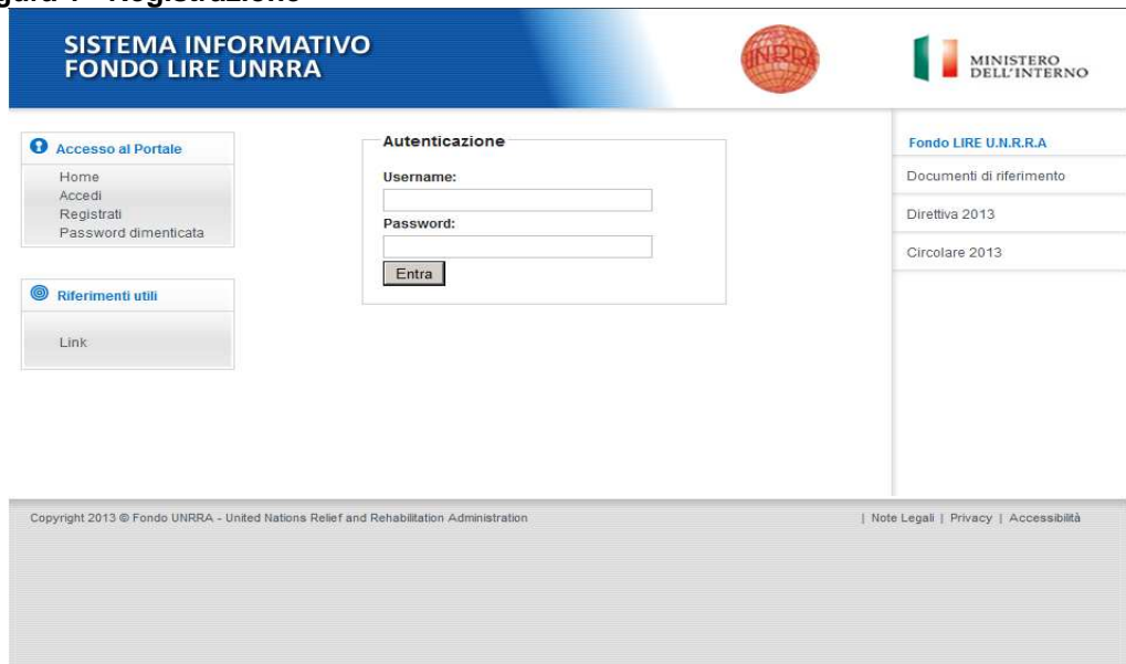
Figura 1 - Registrazione